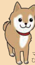
マスコット ひなちゃん

ご葬儀をご依頼いただいた方で、他社積立金のご解約がある場合、 解約手数料1口分を葬儀費用から差し引き、もしくは払い戻しさせていただきます。